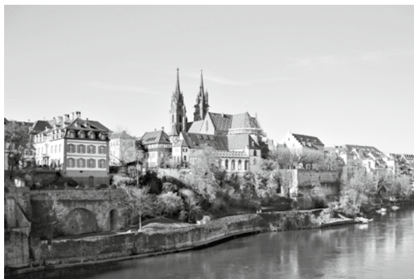
I Basel holdes der danske gudstjenester i Niklauskapelle ved Münster, den gamle katedral ved Rhinen.