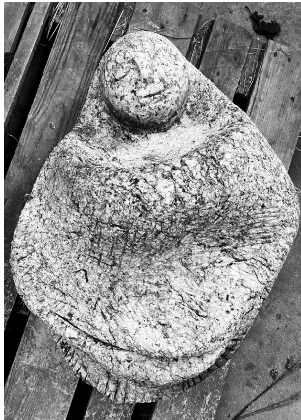
Stenfigur udført af Jean Pierre Louveau - højde på 60 cm - send ide til placering.