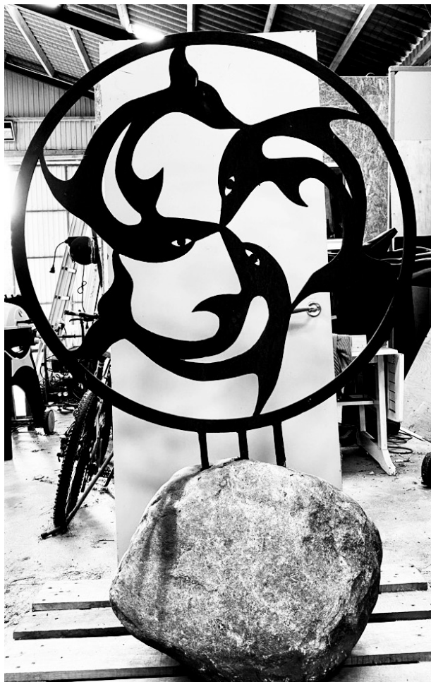
Tre legende delfiner i metal udført af Jean Pierre Louveau - højde på 135 cm - send ide til placering.