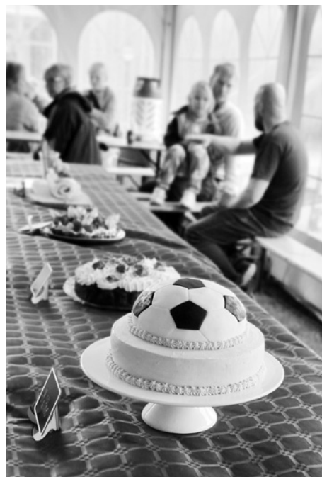
Tornbys Store Bagedysts vinderkage.