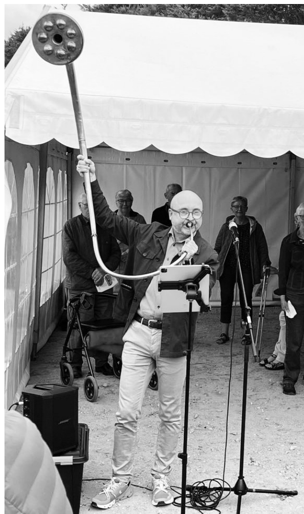
Arkitekten spillede et stykke musik på en medbragt lur.