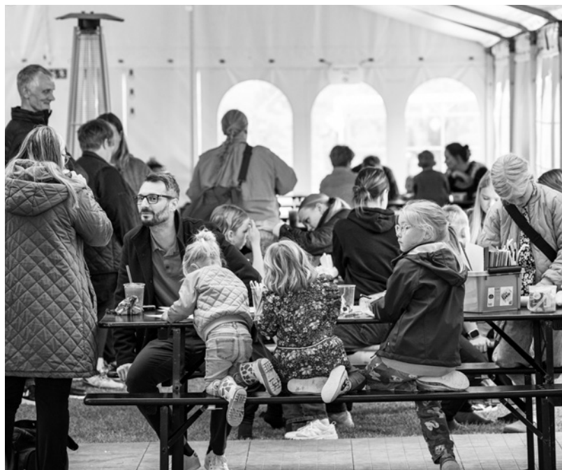
Hygge i teltet.

Tornby Idrætsforening (TIF) er en forening, der bæres af frivillige kræfter. Hvert år siden 1975 har TIF fejret en frivillig, der har gjort en ekstraordinær indsats for foreningen.