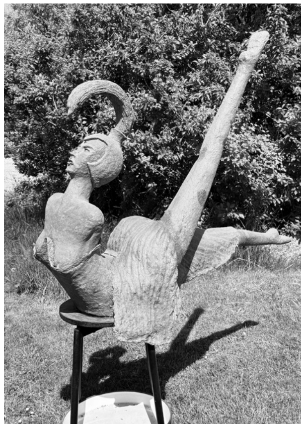
En af de mange skulpturer i papmache.