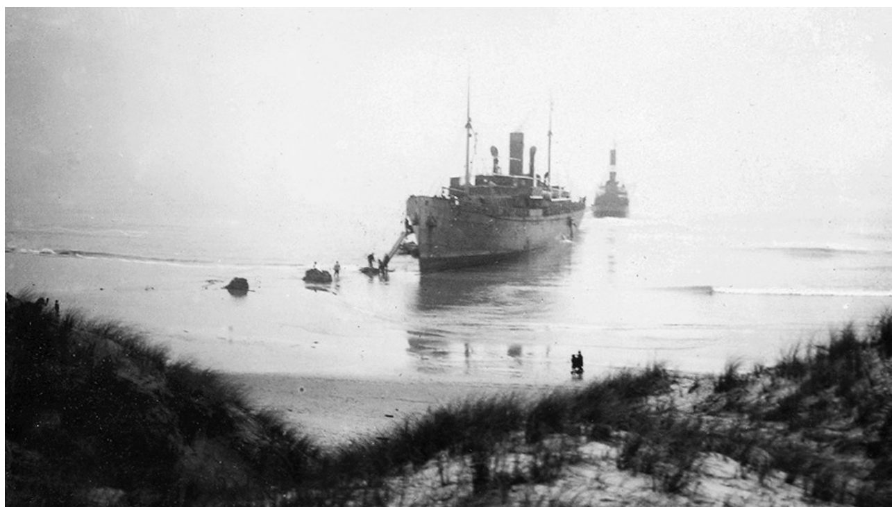
Bellona set fra klitterne ved Tornby Strand. Der arbejdes ved båden og slæbebåden ligger parat. (Tornby-Vidstrup Sognearkiv).