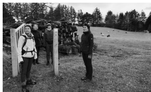
Vandregruppen vvv fra Hjørring gik den 21. november vores første tur på Kirkestien.