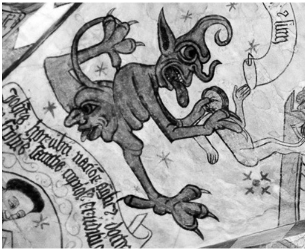
Et af de sjoveste djævelbilleder, vi har her i Vendssyssel, er denne dæmon fra Sæby kirke med ansigt i hoved og r..

Synd, død og djævel – et foredrag om det onde Torsdag den 10. marts kl. 19.30 i Sognegården Tiden mellem fastelavn og påske er i kirkens cyklus den tid, hvor vi besinder os på at modstå det onde. I efteråret holdt jeg tre foredrag om hhv. tro, håb og kærlighed. Det, der bringer lys og mod. Så nu er det blevet tid til at tage fat på mørket. Dog ikke over tre aftener, men en enkelt aften, hvor vi skal ind på hvad det onde er og hvordan det onde virker ind i vores liv. Under overskriften Synd, død og djævel vil jeg undersøge, hvad det onde i virkeligheden er. Er der tale om en reel ondskabsfuld magt med egen bevidsthed? eller er der tale om et fravær, ligesom mørket er et fravær af lys? Eller findes det onde slet ikke?